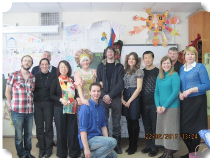
Рис.2 Проект 2011 года «Языки народов мира», наши зарубежные партнеры из разных стран мира

Ниже представлена таблица с репертуарным списком мероприятий по годам, видами мероприятий, формами деятельности и указанием полученного продукта.