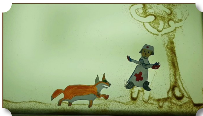
Рис. 2, 3. Кадры из игрового фильма «African stories. Dr. Ouch». Теневые куклы, маски и костюмы выполнены участниками интенсивной сессии.

Центральным текстом интенсивной летней сессии 2022 года была выбрана легенда о Робин Гуде. Основным текстом для интерпретации послужил мультфильм 1973 г. «Робин Гуд» студии Disney, в котором главными персонажами выступили антропоморфные животные. Это дало возможность