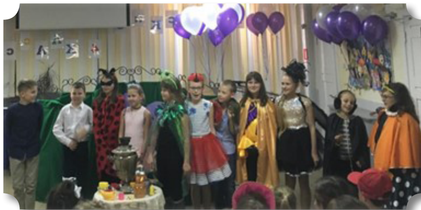
Рис.1 Постановка выпускного спектакля «Муха-Цокотуха»

Подготовка спектакля обычно начинается с третьей четверти. Она включает в себя еженедельные репетиции. Текст сказки редактируется преподавателями таким образом, чтобы реплики героев были выразительными, отражали их характер, но в то же время были сильными для детского восприятия и запоминания.