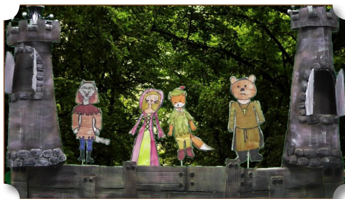
Рис. 4, 5. Кадры из игрового фильма «Robin Hood». Декорации и костюмы выполнены участниками интенсивной сессии