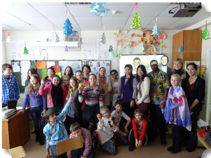
Рис.1 Участники проекта «Мой родной язык», 2012 год

С 2010 года в ЧОУ «София» в Международный день родного языка проводятся различные мероприятия, посвященные теме, связанной с культурой и языками народов стран мира.