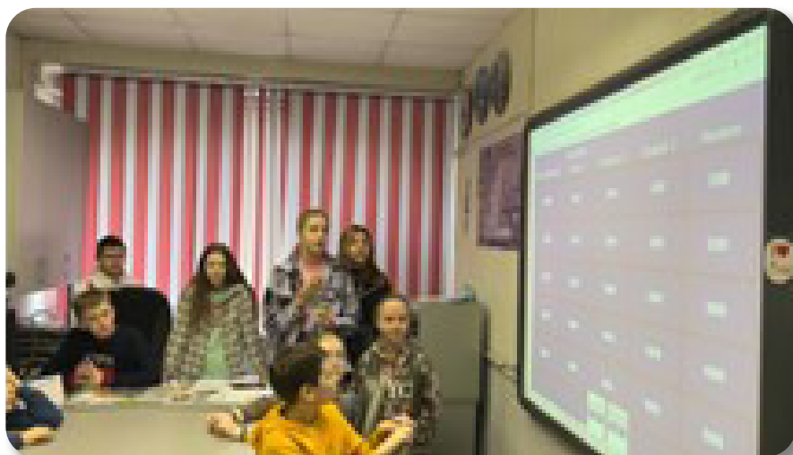
Рис.5 Интеллектуальная игра (по м/ф «Маугли»)

Также на основном этапе участникам игры предлагается озвучить эпизоды из фильма (Dubbing), длящиеся 2-3 минуты. Выполнение данного задания не всегда дается ребятам легко, но оно дает им отличный опыт ведения диалога, спонтанного реагирования на реплики собеседника, своеобразной вовлеченности в кинематографический процесс. На следующем этапе игры (Discussion Questions) участники игры формулируют проблемные вопросы, поднятые в фильме, в ходе совместного обсуждения ищут на них ответы. В конце игры подводятся итоги, происходит самооценка деятельности участников игры, но главным ее итогом является продуктивное речевое и личностное взаимодействие ребят. В связи с тем, что современные подростки ориентированы на восприятие информации через ИКТ, для них может быть создан другой вариант интеллектуальной игры с помощью игрового сайта jeopardylabs.com . Учителя школы «София» создают игры по просмотренным фильмам или мультфильмам.