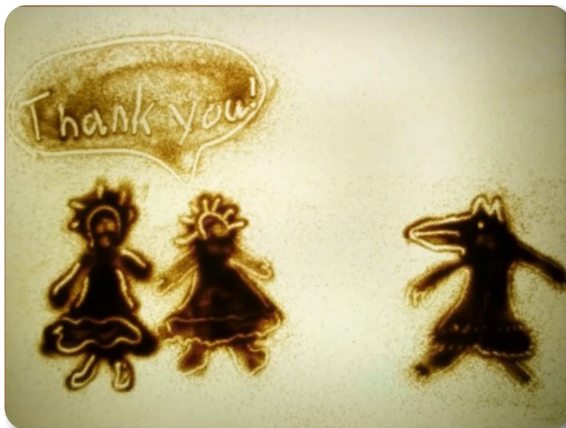
Рис. 1. Кадр из сказки «How sled dogs became fast».

В 2019 году участники придумали собственные сказки, подражая сказкам северных народностей, создали песочную анимацию по собственному сценарию, записали горловое пение и аудиосопровождение на английском языке и нарисовали иллюстрации для сборника сказок на русском и английском языках.