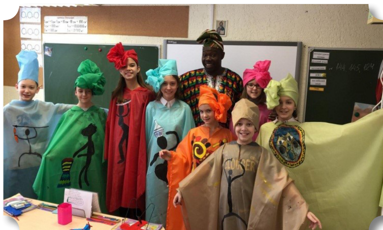
Виртуальное путешествие по Нигерии. 2018 год

Вывод. Организуя такие виды внеурочных интегрированных мероприятий и используя различные формы деятельности, мы помогаем нашим ученикам увидеть многогранность мира, понять, принять и оценить его разнообразие, и совместно со своими учителями, путешествуя этом реальном мире, наряду с заботой о сохранении культурного и языкового наследия, вносить свой вклад в его совершенствование.