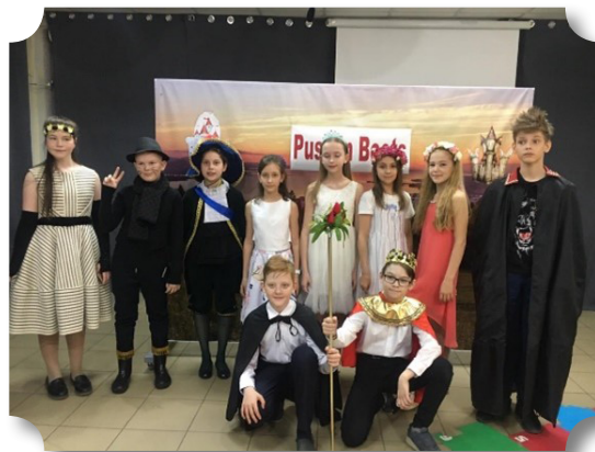
Рис.2 Постановка выпускного спектакля «Кот в сапогах»