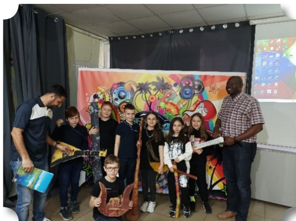
Международный музыкальный этнофестиваль 2022 год