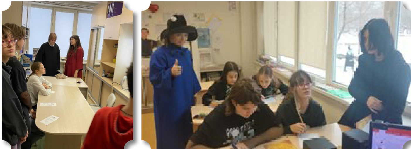
Рис.3,4 Озвучивание эпизодов из фильма «Гарри Поттер»

Также на основном этапе участникам игры предлагается озвучить эпизоды из фильма (Dubbing), длящиеся 2-3 минуты. Выполнение данного задания не всегда дается ребятам легко, но оно дает им отличный опыт ведения диалога, спонтанного реагирования на реплики собеседника, своеобразной вовлеченности в кинематографический процесс. На следующем этапе игры (Discussion Questions) участники игры формулируют проблемные вопросы, поднятые в фильме, в ходе совместного обсуждения ищут на них ответы. В конце игры подводятся итоги, происходит самооценка деятельности участников игры, но главным ее итогом является продуктивное речевое и личностное взаимодействие ребят. В связи с тем, что современные подростки ориентированы на восприятие информации через ИКТ, для них может быть создан другой вариант интеллектуальной игры с помощью игрового сайта jeopardylabs.com . Учителя школы «София» создают игры по просмотренным фильмам или мультфильмам.