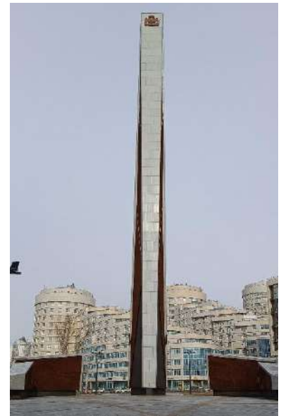
La stèle "Ville du travail vaillant" a été érigée à l'occasion du 300 e anniversaire d'Ekaterinbourg. La stèle est de 42 mètres de haut. Cela rappelle le fait qu'en 1942 l'évacuation des usines à Sverdlovsk a été achevée.

Ekaterinbourg mérite vraiment ce titre. Ses habitants ont joué un rôle crucial dans la victoire grâce à leur ardeur au travail et leur courage.