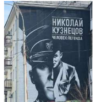
Le portrait de Nikolaï Kouznetsov : graffiti au coin des rues Moskovskaïa et Popova. Ekaterinbourg

L'histoire de Nikolaï Kouznetsov est un exemple de courage, d'héroïsme et d'amour pour son pays. Il est resté fidèle à sa patrie jusqu'à la fin. Son exploit est présenté dans des livres et des films. Son nom est utilisé pour nommer des rues, des écoles et des usines. En 1986, les habitants de Sverdlovsk (actuellement Ekaterinbourg) ont aménagé un sentier de l'éco-randonnée aux alentours de la ville où Nikolaï Kouznetsov aimait se promener.