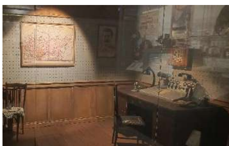
La reconstruction du bureau de Youri Lévitane. Le musée de l'Histoire de la guerre « Sverdlovsk : Moscou parle ». Ekaterinbourg