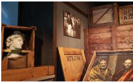
À chaque objet son emballage. Trois bâtiments à Sverdlovsk ont abrité 1200000 objets d'art évacués.

La guerre s'étant déclenchée inopinément, l'évacuation des collections de l'Hermitage devait être effectuée dans les délais les plus courts. Grâce à la préparation préalable (dès 1938) l'emballage de 500000 oeuvres d'art n'a pris qu'une semaine. Jour et nuit, les employés du musée travaillaient ne