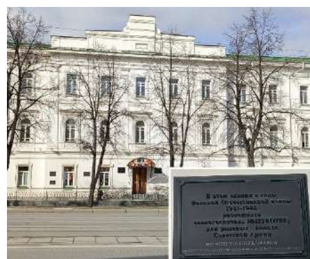
L'École N° 9 d'Ekaterinbourg a abrité deux hôpitaux militaires : N° 1326 (1708) de 1941 à 1943 et N° 3866 de 1941 à 1945

Les médecins, les infirmiers et les soignants ont réalisé un exploit auquel s'ajoute celui des habitants qui, pendant la période de guerre, ont donné plus de 70 tonnes de sang.