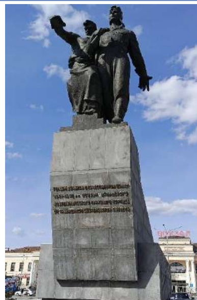
Le monument aux soldats du Corps de chars de volontaires de l'Oural. Sculpteurs : V. M. Druzin, P. A. Sajin. Ekaterinbourg, place Privokzalnaïa

Adapté d'après http://history-udtk.ru/about/